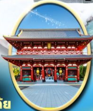
วัด เซ็นโซจิ