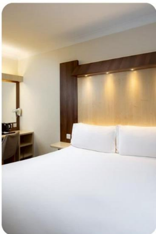
ห้องพัก สำหรับ 2 ท่าน DOUBLE ROOM (DBL)