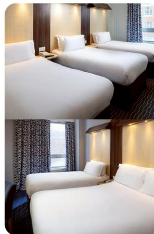
ห้องพัก สำหรับ 3 ท่าน TRIPLE ROOM (TRP)

กรณีห้อง Twin Bed ของทางโรงแรมไม่มีหรือเต็ม ทางบริษัทขอปรับเป็นห้อง Double Bed แทน หรือ หากต้องการห้องพักแบบ Double Bed ของทางโรงแรมไม่มีหรือเต็ม ทางบริษัทขอปรับเป็นห้อง Twin Bed แทน และหากต้องการพักแบบ Triple Room ของทางเราไม่มีหรือเต็ม ทางบริษัทขอปรับเป็นห้อง 1 เตียงใหญ่ (Queen Size) + 1 เตียงเล็กแทน โดยมีต้องแจ้งให้ทราบล่วงหน้า