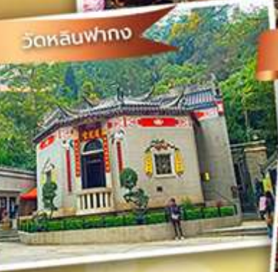
องค์อ้อยส้ม