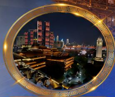
มือคำร้านอาหารวิวหลักล้าน ชมแสงสีเมืองลงชิง