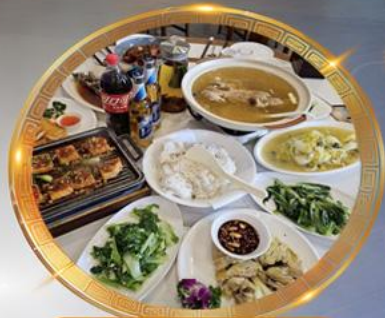
โต๊ะจีนลงชิง เมบูตันตำรับ รสจัดจ้านแท้ๆ