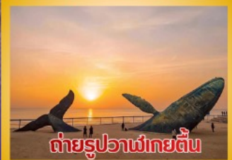
ต่ายรูปวาฬไทยตีน

สะพานจันเจียว-โบสถ์คาทอลิกชิงเต่า (ชมภายนอก)-ป่าตึกวน-พิพิธภัณฑ์เบียร์ชิงเต่า -ถนนคนเดินโตตง -ผิงไห่ลเก้อ-ชายหาดและจุดต่ายรูปปลาวาฬไทยตีน -ถนนจ้าววีป่าเจียว-ชายหาดลากอเวย์ไห่-จัตุรัสซิงฟุเหมิน-สวนเว่ยไห่ -สวนเยวี่ไห่-เกาะหยางหม่าย่าน - เมืองท่าเหยียนไถ่-ท่าเรือชาวประมงเหยียนไถ่-ภูเขาเหยียนไถ่-จัตุรัส 54 -ศูนย์โอลิมปิกเรือใบชิงเต่า-ภูเขาเหล่าซาน-วัดไท่ซิงกง-สวนเสี่ยวม่วยเต่า-ชายหาดทะเลหมายเลข 3-อาคารไห่เทียน ชั้น 81- Cyber Punk