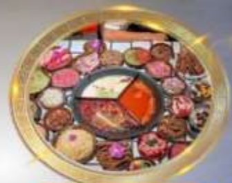
บุฟเฟต์หมีผิงไฟหลงชิ่ง