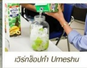
เวิร์กช็อปทำ Umeshu