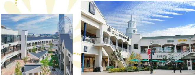
SHOPPING AT RINKU PREMIUM OUTLET

ซอปปิ้งละลายทรัพย์ส่งท้ายที่ “ริงคุ พรีเมียม เอาท์เลต” แหล่งรวมสินค้าแบรนด์เนมชั้นนำระดับโลกในราคาลดพิเศษสุดคั้ม อีสาระให้ท่านเพลิดเพลินกับการช้อปปิ้งแฟชั่น เลือกซื้อเสื้อผ้า กระเป๋า และรองเท้าคู่ใจในบรรยากาศเอาท์เล็ตสไตล์รีสอร์ทที่กว้างขวาง พร้อมเดินซอปปิ้งรับลมทะเลเย็นสบาย หรือเว้านั่งพักผ่อนชิลๆ ตามคาเฟ่และร้านอาหารภายในพื้นที่ได้อย่างอิสระตามไลฟ์สไตล์ของท่าน