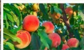
เก็บลูกพีชสด ๆ จากต้น