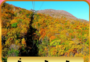
นั่งกระเช้าอุซุซัง