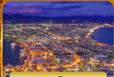
ชมวิวฮาโกดาเตะ