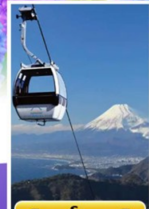
อิซุฟานิรามาวิว