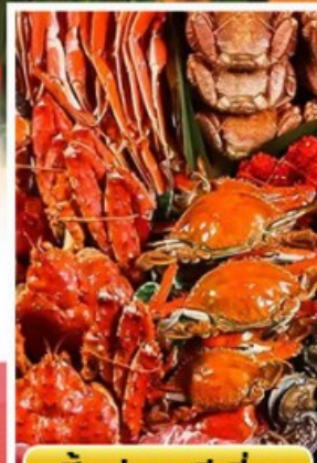
ปิ้งย่างพรีเมียม