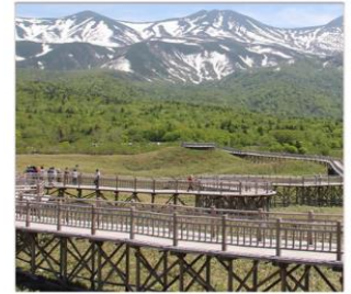
ทะเลสาบทั้ง 5 ชิเรโตโกะ