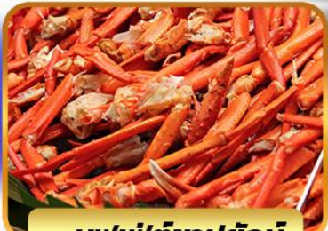
บุฟเฟ่ต์ขาปูยักษ์

ฟรีเดย์โตเกียว 1 วัน อิสระ ช้อปปิ้งหรือช้อปปิ้งทัวร์เสริมดั่งสนีย์แลนด์ 27 ธ.ค. - 01 ม.ค. 2568