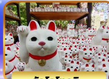
วัดโทโทคุจิ