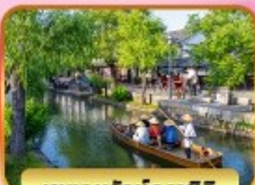
เบตอบุรุกบิคุราชิกิ