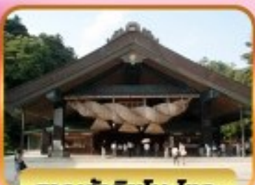
ศาลเจ้าอิซุโมะโทะวะ