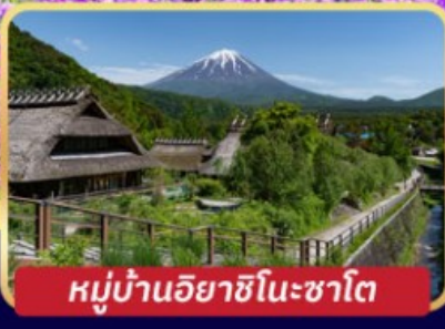
หมู่บ้านอียาชิโนะซาโตะ