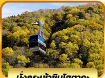
นั่งกระเช้าชินโฮตากะ