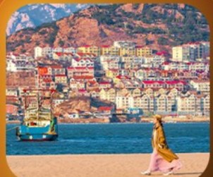
"หมู่บ้านประมงซาจื่อโจว"