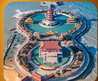
"แปดเซียนข้ามทะเล"

เส้นทางเมืองชายฝั่งจีนตอนเหนือ • เวนิสตะวันออก • เก็บผลไม้ ณ สวนต้าเหลียน เมืองเหยียนโต • ท่าเรือไห่ซาง ปลายวาฟกยตัน • เมืองเฝิงไห่ • แปดเซียนข้ามทะเล เมืองเว่ยไห่ • ถนนคอบเพลิงเลว 8 • ซากเรือบลูวู • Korean Town • หมู่บ้านซาจื่อโจว สะพานจันเจียว • โบสถ์เซนต์ไมเคิล • พิพิธภัณฑ์เบียร์ชิงเต่า • อ่าวผู้ซานวาน