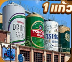
"พิพิธภัณฑ์เบียร์ชิงเต่า"

เส้นทางเมืองชายฝั่งจีนตอนเหนือ • เวนิสตะวันออก • เก็บผลไม้ ณ สวนต้าเหลียน เมืองเหยียนโต • ท่าเรือไห่ซาง ปลายวาฟกยตัน • เมืองเฝิงไห่ • แปดเซียนข้ามทะเล เมืองเว่ยไห่ • ถนนคอบเพลิงเลว 8 • ซากเรือบลูวู • Korean Town • หมู่บ้านซาจื่อโจว สะพานจันเจียว • โบสถ์เซนต์ไมเคิล • พิพิธภัณฑ์เบียร์ชิงเต่า • อ่าวผู้ซานวาน