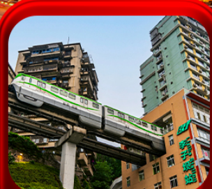
“ นิ่งรโฝทะเลตุ๊ก ”

บินตรงลงธงชิง • อุ๋หลง หลุมฟ้าสะพานสวรรค์ • ระเบียงแกว • อุทยานเขานางฟ้า หงหยาดัง • นิ่งรโฝทะเลตุ๊ก • ศาลาประชาคม (ด้านนอก) • หลงหมินฮ่าว มรดกโลกผาหินแกะสลักต้าจู้ • วัดหลิวฮั่น • ตึกตะเกียบ • หมู่บ้านโบราณสี่ซีโหว่