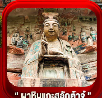
“ ผาหินแกะสลักต้าจู้ ”

บินตรงลงธงชิง • อุ๋หลง หลุมฟ้าสะพานสวรรค์ • ระเบียงแกว • อุทยานเขานางฟ้า หงหยาดัง • นิ่งรโฝทะเลตุ๊ก • ศาลาประชาคม (ด้านนอก) • หลงหมินฮ่าว มรดกโลกผาหินแกะสลักต้าจู้ • วัดหลิวฮั่น • ตึกตะเกียบ • หมู่บ้านโบราณสี่ซีโหว่