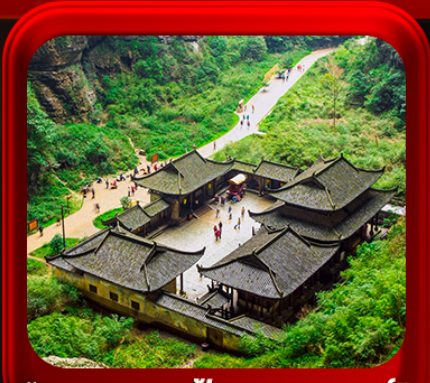
“ อุทยานหลุมฟ้าสะพานสวรรค์ ”