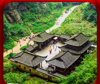
“ อุทยานหลุมฟ้าสะพานสวรรค์ ”

T2G-CKG27CZ Best of Chongqing...ฉงชิ่ง ต้าจู้ อุ่หลง อุทยานหลุมฟ้า เขานางฟ้า 6D 4N (CZ)