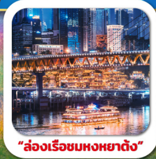
"ล่องเรือชมหงหยาดัง"