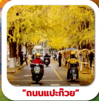
"ถนนแปะก๊วย"