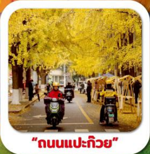
"ถนนแปะก๊วย"

นั่งกระเช้าชมภูเขาหวงอู่ซาน ขุนเขาใบไม้แดงอันดับหนึ่งของประเทศจีน เมืองชู่หนิง วัดหลิงจวน (วัดเจ้าแม่กวนอิมกะพริบตา) - พาสินแกะสลักต้าจู้ หงหยาดัง ถนนแปะก๊วย ตึกตะเกียบ วัดหลัวซัน ล่องเรือชมวิวฉงชิ่ง