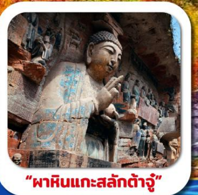
"พาสินแกะสลักต้าจู้"