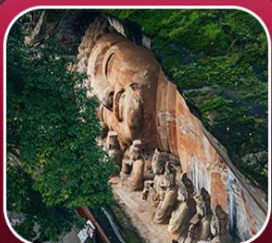
“ผาหินแกะสลักต้าจู้”