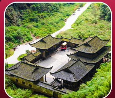
“อุทยานหลุมฟ้า”

T2G-CKG34(3U) The Best Chongqing...ฉงชิ่ง ต้าจู้ อุ้หลง เขานางฟ้า 5D 4N (3U)