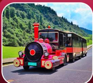
“อุทยานเขานางฟ้า”