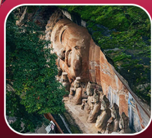
“ผาหินแกะสลักต้าจู้”