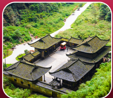
“อุทยานหลุมฟ้า”