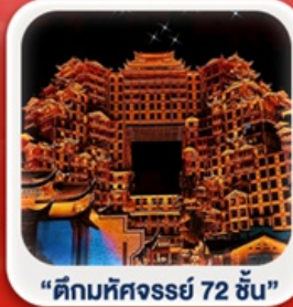
“ตึกมหัศจรรย์ 72 ชั้น”