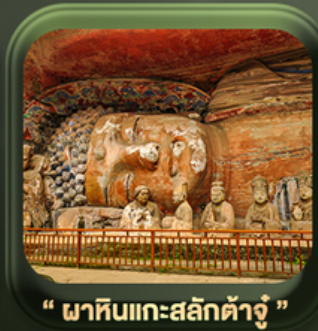
“ พาคินแกะสลักต้าจู้ ”

วันเดินทาง มี.ค. - ต.ค. 2569 ราคาเริ่มต้น 22,999.-