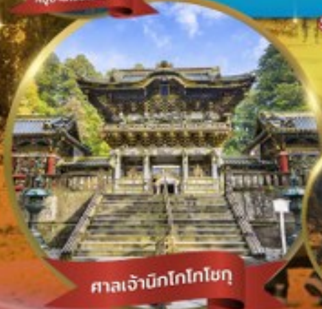
ศาลเจ้านิกโกโทโกโฮกุ