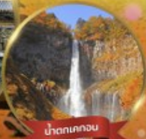
น้ำตกเคกอน