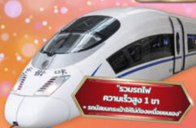
"รวมรถไฟความเร็วสูง 1 ไร่ + รถบริการกระเป๋าไม่ใช่นั่งรถของเรา"