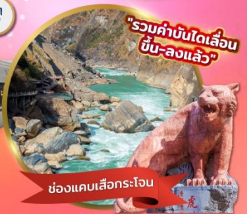
"รวมค่าบัตรรถไฟความเร็วสูง ขึ้น-ลงแล้ว"