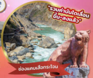
"รวมค่าบินได้เลื่อนขั้น-ลงแล้ว"