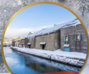
คลองโอตารุ