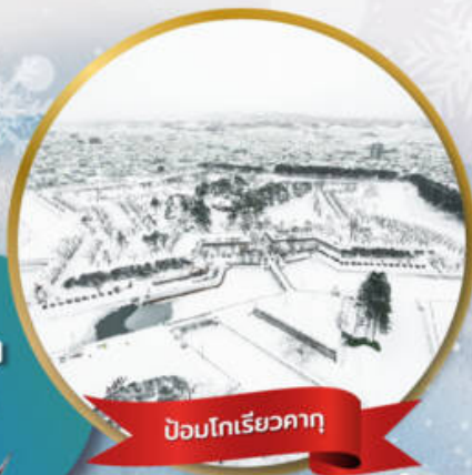
ป้อมโทริเยวคาคุ

หมู่บ้านนิงเกิลเกอเรส • สวนสัตว์อาซาฮิยาม่า • ชมขบวนพาเหรดเพนกวิน ตลาดเช้าฮาโกดาเตะ • ป้อมโทริเยวคาคุ • นั่งกระเช้าชมเมืองฮาโกดาเตะ ลานสกี • HILL OF BUDDHA • โอตารุ • คลองโอตารุ • หมู่บ้านราเมน