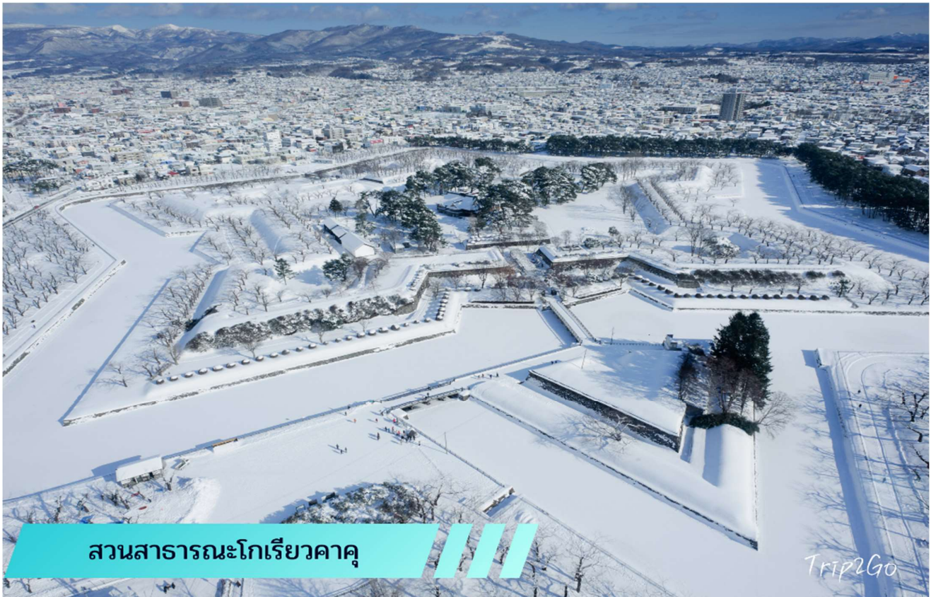
สวนสาธารณะโกเรียวกาคู

จากนั้น เดินทางเข้าสู่ บ่อมปราการโกเรียวกาคู (GORYOKAKU) ตั้งอยู่ใจกลางเมืองฮาโกดาเตะ เมื่อมองจากการออกแบบห้าด้านแล้ว จะเห็นได้ชัดว่าเป็นบ่อมปราการทรงดวงดาว เพราะบ่อมปราการแห่งนี้ได้รับการออกแบบโดยทาเคดะ อะยะซะบุโระ และได้รับอิทธิพลทางการออกแบบจากเวบบัน วิศวกรทางทหารชาวฝรั่งเศสบ่อมแห่งนี้เป็นบ่อมปราการแห่งแรกในรูปแบบตะวันตกในประเทศญี่ปุ่น บ่อมแห่งนี้ได้สร้างเสร็จในปี ค.ศ.1864 (ราคาทัวร์ไม่รวมค่าลิฟต์ขึ้นชมหอคอย คนละประมาณ 800 เยน)