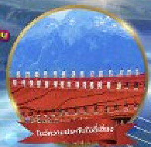
รวมค่ารถไฟหัวขบวน