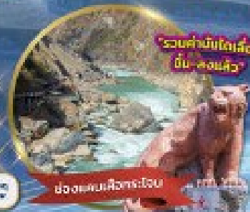
ช่องแคบเสีงกระโถน