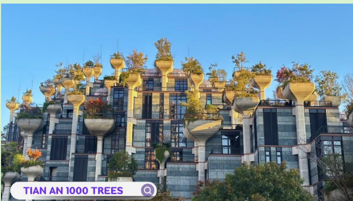
TIAN AN 1000 TREES

นำท่านเดินทางสู่แลนด์มาร์กใหม่ของเซี่ยงไฮ้ คือโครงการ TIAN AN 1,000 TREES ตัวโครงการมีทั้ง สวนสาธารณะร้านอาหาร ศิลปะ ห้องพัก มีทุกอย่างเท่าที่ท่านจะนึกได้ ออกแบบโดยสถาปนิกชาวอังกฤษ โทมัส เฮเธอร์วิก Tian An 1,000 Trees มีสองส่วน คือ Tian'an Qianshu และ Platform Garden บนชั้นหนึ่งและสองของอาคารเดิมเป็นที่ตั้งของโรงงานแปงเซี่ยงไฮ้มีความหลากหลายมากเพราะเป็นย่านศิลปะมีทั้งบ้านเรือน โรงงาน ศิลปะ ร้านอาหารเยอะแยะมากมาย แต่ทุกอย่างกระจุกกระจายอยู่ตามที่ต่างๆแบบต่างคนต่างอยู่ Tian An 1,000 Trees จึงเป็นเหมือนตัวกลางที่เชื่อมทุกอย่างให้เข้ากันทั้ง ตัวสถาปัตยกรรม ธรรมชาติ ศิลปะ และวิถีชีวิตผู้คน ได้อย่างลงตัว หลังจากนั้นนำท่านไหว้พระสมสิริมงคลที่ วัดพระหยก (Jade Buddha Temple) เป็นวัดพุทธที่มีชื่อเสียงและยังคงมีการใช้งานอยู่ในปัจจุบัน ตั้งอยู่ใจกลางเมืองเซี่ยงไฮ้ วัดแห่งนี้มีชื่อเสียงจากพระพุทธรูปที่แกะสลักจากหยกขาวอันงดงามที่นำมาจากประเทศพม