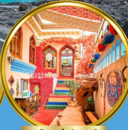
เมืองเก๋าคิชการ์