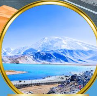
Kala Kule Lake