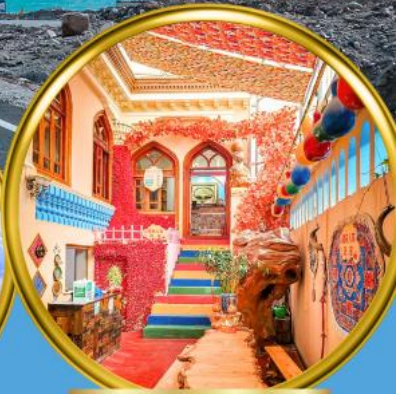
เมืองเก่าคัชการ์