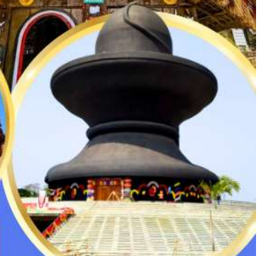
วัมมหาฤตยูชัย