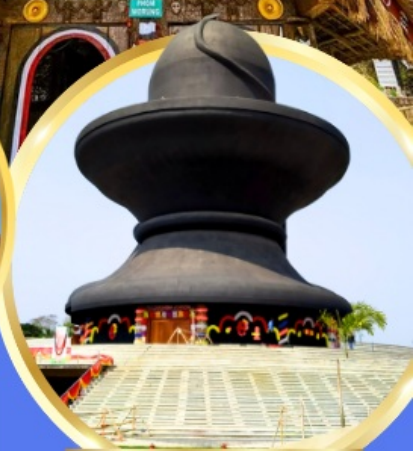
วันมหาฤตยูชัย