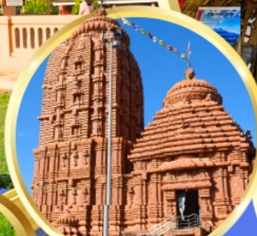
เทวาลัยศรีจักรนารท แห่งตีบูรกาห์