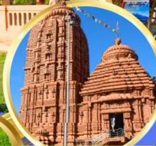
เทวาลัยศรีจักรนารท แห่งดีบุรกาห์