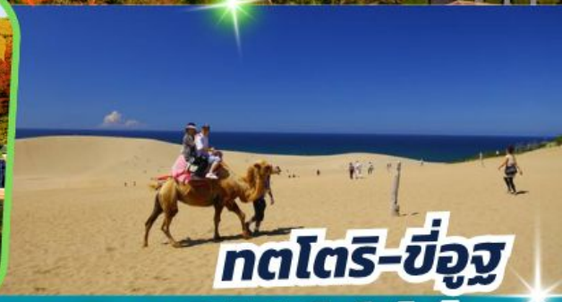
ทตโตริ-ซึอูจ