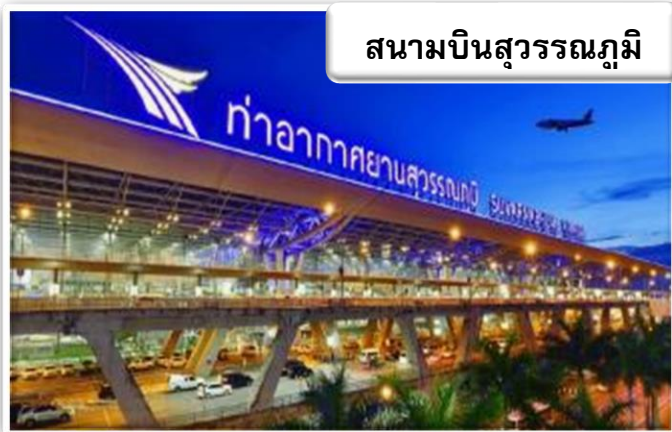
สนามบินสุวรรณภูมิ

เวลา 22.30 น. พร้อมกันที่ สนามบินสุวรรณภูมิ อาคารผู้โดยสารขาออกระหว่างประเทศ