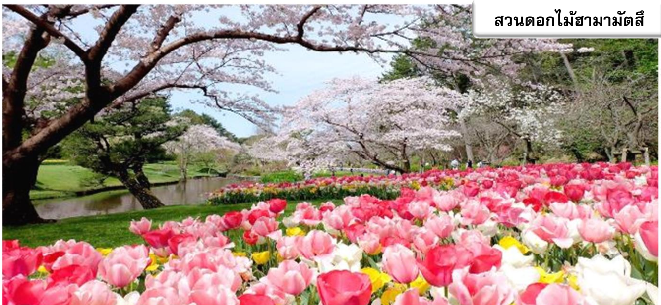
สวนดอกไม้ฮามามัตสึ