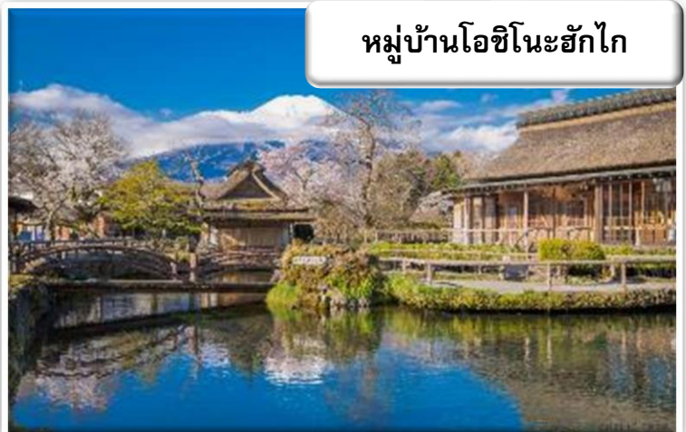
หมู่บ้านโอชิโนะฮักไก

เป็นหมู่บ้านที่ตั้งอยู่ใกล้ภูเขาไฟฟูจิ บริเวณทะเลสาบยามานาคาโกะ (Lake Yamanaka-ko) ซึ่งในปี 2013 ฟูจิซังได้รับเลือกให้เป็นมรดกทางวัฒนธรรมของโลก ที่นี้เองก็ได้รับเลือกในฐานะส่วนหนึ่งของฟูจิซังด้วย และเพราะในบริเวณนี้มีบ่อน้ำใสๆ รวมกันกว่า 8 บ่อ ทำให้คนไทยเราเรียกที่นี่ว่า "หมู่บ้านน้ำใส" นั่นเอง