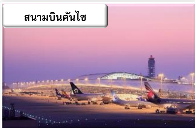
สนามบินคันไซ

เวลา 01.15 น. ออกเดินทางสู่ สนามบินคันไซ ประเทศญี่ปุ่น โดย สายการบินไทยแอร์เอเชียเอ็กซ์ เที่ยวบินที่ XJ 612