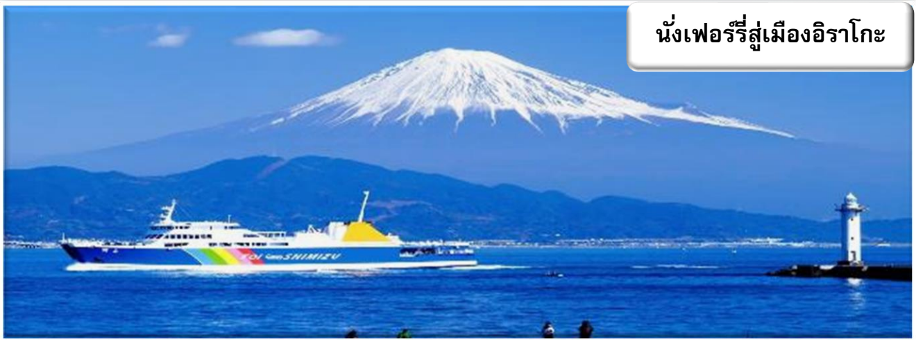
นั่งเฟอร์รี่สู่เมืองอิราโกะ

นำท่าน นั่งเฟอร์รี่สู่เมืองอิราโกะ เรือเฟอร์รี่ข้ามอ่าวชิรุกะนั้นเป็นถนนเส้นทางพิเศษของจังหวัดที่อยู่เหนือน้ำซึ่งจดทะเบียนเป็นเส้นทางหมายเลข 223 (ซึ่งสามารถอ่านออกเสียงได้ว่า ฟุจิซัง ในภาษาญี่ปุ่น) เรือเฟอร์รี่นี้แล่นข้ามอ่าวชิรุกะ ซึ่งเป็นหนึ่งในอ่าวที่สวยงามที่สุดในโลก และเชื่อมต่อกับท่าเรือชิมิซึและท่าเรือนิชิอิซุโทอิโดยใช้เวลาเดินทาง 70 นาที เพลิดเพลินไปกับทัศนียภาพอันตระการตาของสถานที่มรดกโลกอย่างภูเขาไฟฟูจิและดงสนมิโสะโนะมัตสึบาระจากห้องรับรองสุดหรู และสุขใจไปกับการล่องเรืออันแสนผ่อนคลายและไม่มีรถติดบนพื้นทะเล