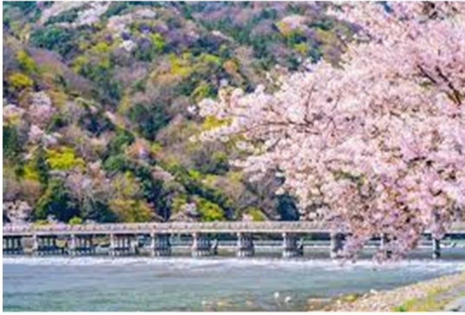
อาราชิยาม่า – สะพานโทเกิตสึ

เดินทางสู่ อาราชิยาม่า (Arashiyama) สถานที่สุดโรแมนติกที่แม้แต่ชาวญี่ปุ่นเองยังมักจะไปเที่ยวพักผ่อนในวันหยุดเพื่อชื่นชมกับความสวยงามตามธรรมชาติ โดยเฉพาะอย่างยิ่งในช่วงฤดูใบไม้ผลิ การได้มาชื่นชมความสวยงามของดอกซากุระที่ได้รับการคัดเลือกให้เป็นหนึ่งในสถานที่แนะนำสำหรับชมซากุระในเมืองเกียวโต สะพานโทเกิตสึเคียว ที่มีความยาว 250 เมตร ข้ามแม่น้ำโฮอิงว่าตั้งอยู่บริเวณเชิงเขาอาราชิยาม่าและยังคงลักษณะเหมือนในคริสต์ศตวรรษที่ 17 แม้จะบูรณะใหม่ด้วยเหล็กแล้วก็ตาม ในฤดูใบไม้ผลิและใบไม้เปลี่ยนสี ยังเป็นอีกสถานที่ที่มีชื่อเสียงในการชมดอกไม้อีกด้วย