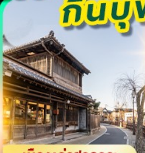
เมืองเก้ฮอวาระ