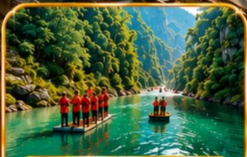
อุทยานจินหลีซาน