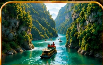
ผิงชานแกรนด์แคนยอน