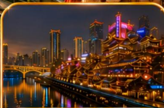
หงหยาดัง ฉงชิ่ง