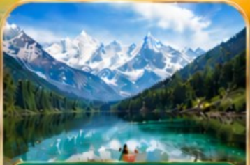
กูเขาสีดรุณี หุบเขาชวงเฉียวโกว (รวมรถอุทยาน)