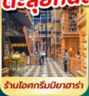
ร้านไอศกรีมมियाฮาร่า