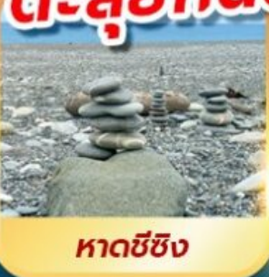
หาดชี่ซิง

เดินชมวิวเกาะเหอฝิง ตะลุยกินตลาดมึชลินเหลาเหอ