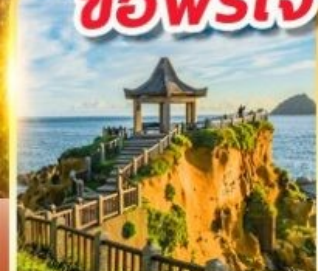
เกาะเหอผิง

พักย่านซีเหมินติง 2 คืน ขอพรเจ้าแม่กวนอิมพันมือ