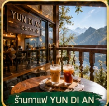
ร้านกาแฟ YUN DI AN