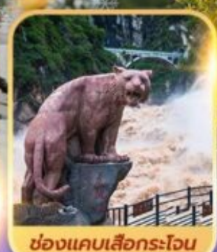
ช่องแคบเล็องกระโจน