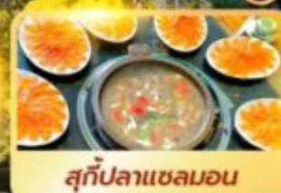
สุกี้ปลาแซลมอน