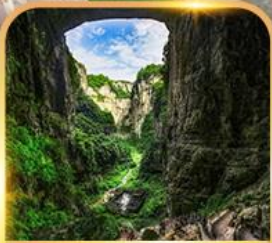
อุทยานหลุมฟ้า 3 สะพานสวรรค์