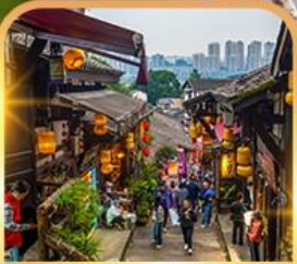
หมู่บ้านโบราณฉือชี่โจว