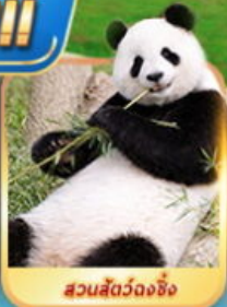
สวนสัตว์จงชิ่ง