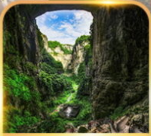
อุทยานหลุมฟ้า 3 สะพานสวรรค์