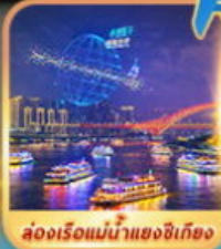
ล่องเรือแม่น้ำแยงซีเกียง