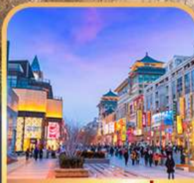
ถนนหวงฟูจิ่ง