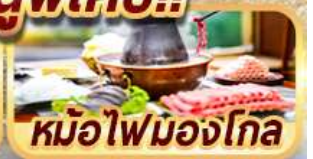
หม้อไฟมองโกล