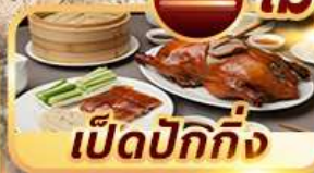
เป็ดปักกิ่ง