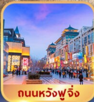
ถนนหวังฟูจิ่ง