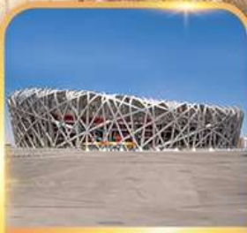
สนามกีฬาρινอก