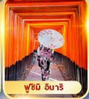
ฟูชิมิ อินาริ