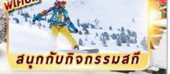
สนุกกับกิจกรรมสกี