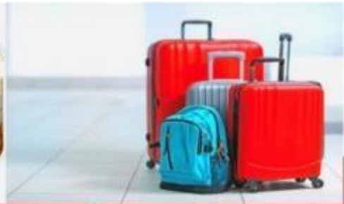
น้ำหนักกระเป๋า สูงสุด 20 กก.

08:40 ถึง สนามบินคันไซ ประเทศญี่ปุ่นดินแดนอาทิตย์อุทัย