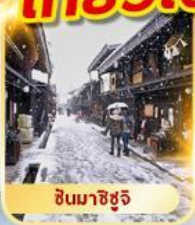
ชินจิโกะ