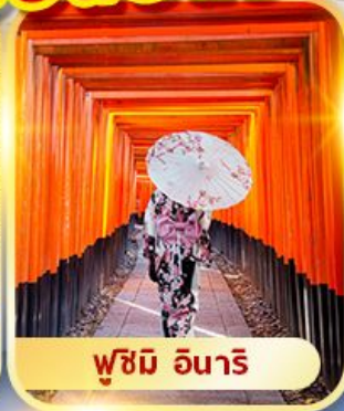
ฟูชิมิ อินาริ