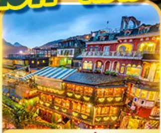
หมู่บ้านฮู้เฟิน