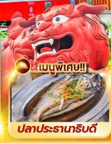
เมนูพิเศษ!!