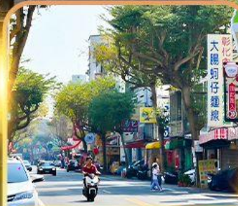
ถนนโบราณอันผิง