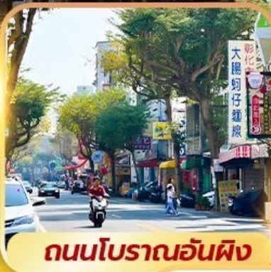
ถนนโบราณอันผิง