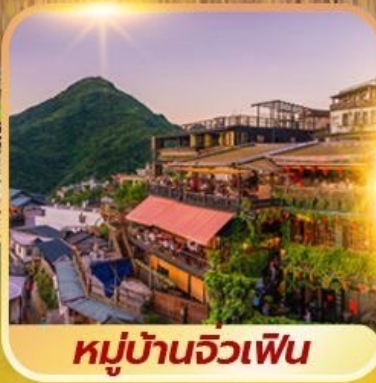
หมู่บ้านจิวเฟิน