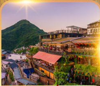
หมู่บ้านจิวเฟิน