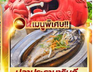
เมนูพิเศษ!! ปลาประรานาธิบดี