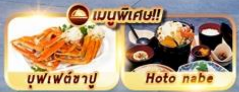
บุฟเฟ่ต์ชาบู