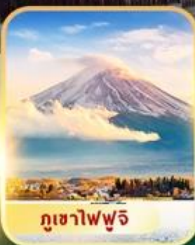
ภูเขาไฟฟูจิ