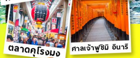
ตลาดคุโรมง ศาลเจ้าฟูชิมิ อินาริ