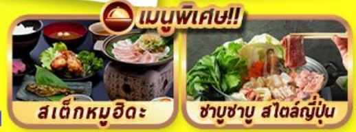
เมนูพิเศษ!! สเด็กหมูฮิดะ ซาซุซาบู สัตลัญญ์