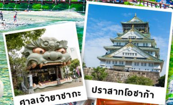
ศาลเจ้ายาซากะ ปราสาทโอซาก้า