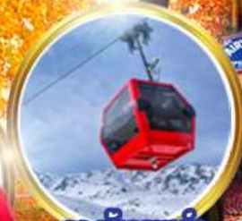
กระเช้ากุลมาร์ค ชมวิวสุดอลังการ