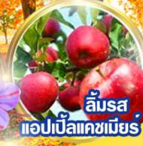
ลิ้มรส แอปเปิ้ลแคชเมียร์