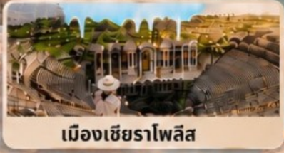
เมืองเซียร์าโพลิส