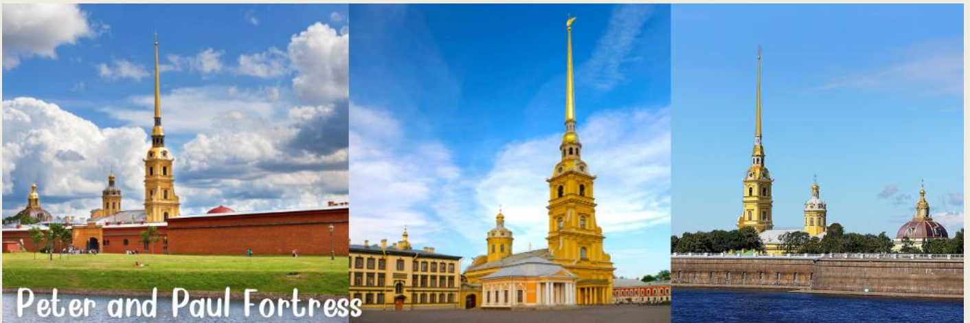
Peter and Paul Fortress

กลางวัน 📍 รับประทานอาหาร ณ ภัตตาคารท้องถิ่น นำท่านชม บ้อมปีเตอร์ แอนด์ ปอลด์ (Peter And Paul) เป็นสิ่งก่อสร้างแรกสุดของเมือง St Petersburg สร้างในปีค.ศ 1703 เป็นอนุสรณ์ชัยชนะสงครามเหนือสวีเดน ด้วยศิลปะแบบบารอกเพื่อใช้เป็นบ้อมปราการในการป้องกันข้าศึกกรูกราน ตั้งอยู่บน เกาะวาซิลเยฟสกี (Vasilievsky Island) ลักษณะเป็นรูปทรงหกเหลี่ยม กำแพงเป็นหินก่ออิฐ ส่วนวิหารปีเตอร์ แอนด์ ปอลด์ (Peter-and-Paul-Fortress) เริ่มสร้างขึ้นเมื่อปีค.ศ 1712 ด้วยการ ออกแบบของ DomennicaTrezzini สร้างเสร็จในวันที่ 29 มิถุนายน ค.ศ 1733 ตั้งชื่อวิหารแห่งนี้เพื่อเป็นเกียรติแด่นักบุญปีเตอร์ และนักบุญปอลด์เพื่อเป็นการเผยแพร่ศาสนา ความสูงของยอดแหลมคือ 122.5 เมตร ในอดีตเป็นสิ่ง ก่อสร้างที่สูงที่สุดของเมืองและห้ามสร้างสิ่งก่อสร้างใดสูงกว่า ภายในทำการตกแต่งด้วยศิลปะบารอกซึ่งนับว่าแตกต่าง กับโบสถ์คริสต์ออร์ทอดอกซ์ทั่วไปและวิหารแห่งนี้ยังเป็นที่เก็บพระศพของราชวงศ์โรมานอฟ เริ่มต้นจากพระเจ้าปีเตอร์มหาราชเป็นองค์แรก จนกระทั่งถึงกษัตริย์องค์สุดท้ายของราชวงศ์