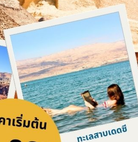
ทะเลสาบเดดซี