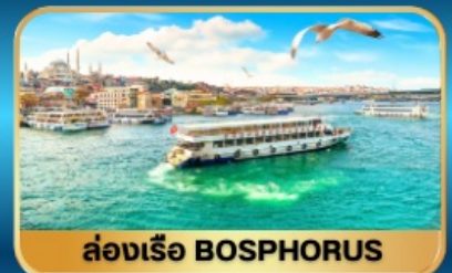
ล่องเรือ BOSPHORUS